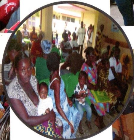
MOTHERS AND CHILDREN LISTENING TO INFORMATION ABOUT CHILD GROWTH FROM DUBEB.