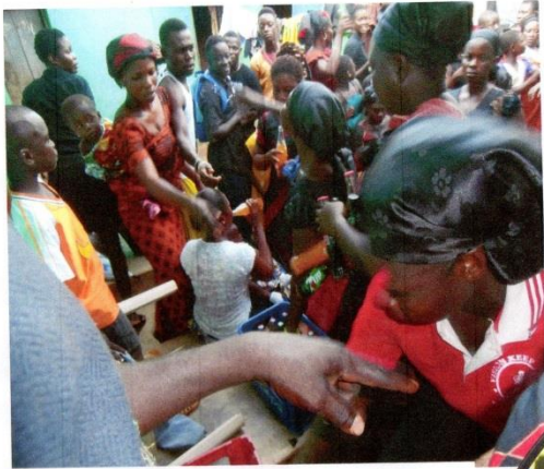
REFRESHMENT AFTER INFORMATION ABOUT THE CLINIC AT ATRONIE.