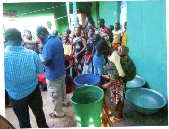
INFORMATION GIVEN TO THE INHABITANTS OF ATRONIE COMMUNITY OVER WATER PROJECT.