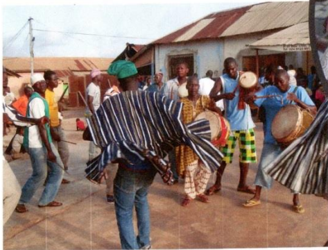
APPRECIATION DANCE FROM THE COMMUNITY TO DUBEB & WORAE CARE ORGANIZATION SAYING THANKS FOR THEIR GOOD WORK.